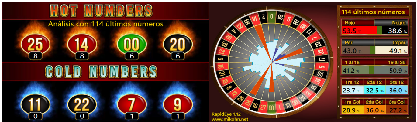
7• RapidEye - Publicidad

Este módulo muestra las estadísticas de las jugadas realizadas en la ruleta; para generar estos cuadros, el sistema utiliza con una cantidad configurable, las últimas jugadas para indicar cuales son los números que mas salen (hot numbers) y los que menos salen (cold numbers), que color sale mas seguido entre otros datos.