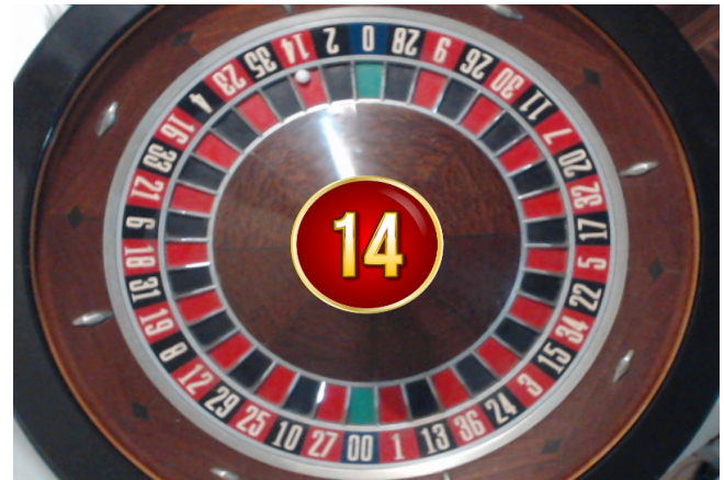
6• RapidEye - Visor de ruleta