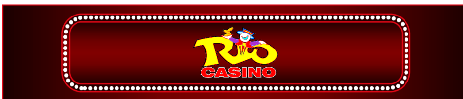
3• RapidEye - Cabecera

En este módulo se puede llenar datos como el nombre del casino o el logo del mismo.